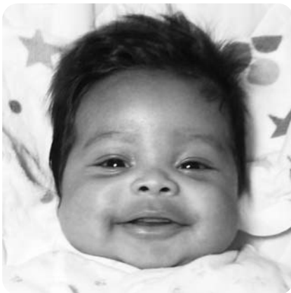
若松町 山元 ゲリーちゃん（1カ月） 元気いっぱいのおんぱく君になって ね～♪大好き♡