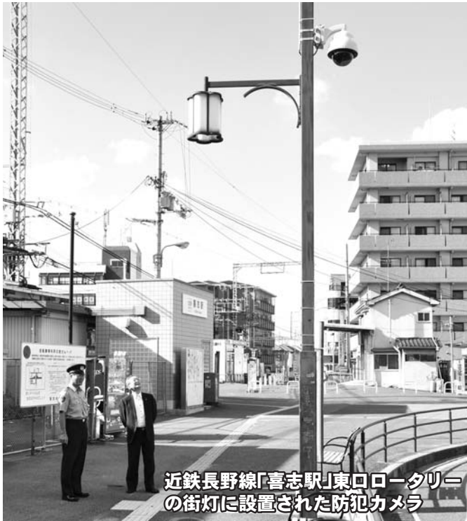
近鉄長野線「喜志駅」東口ロータリーの街灯に設置された防犯カメラ

そこで、4月には住民の安全確保と街頭犯罪などの抑止を図り、安全で安心な地域づくりを推進するため、富田林警察署と本市、太子町、河南町、千早赤阪村が、防犯カメラ設置による「安全・安心なまちづくり」の推進に関する協定を締結しました。