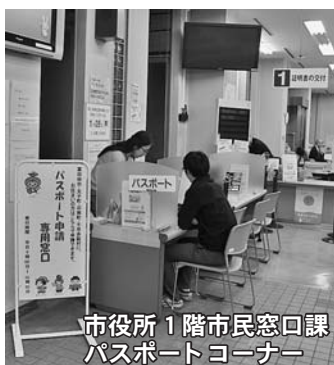
市役所1階市民窓口課パスポートコーナー

府パスポートセンターでも手続きできます 従来通り、府パスポートセンター（☎06（6944）6626）でも手続きができます。なお、次の場合は、同センターでの手続きとなります。 ■外務省と協議する必要がある特殊な場合 ■業務上などの理由により、パスポートを早期に発給する必要がある場合 ■学校などから団体申請する場合 ■震災特例旅券を申請する場合 ※その他、詳しくは一般旅券発給申請書に添付の案内、または市ウェブサイトの市役所のご案内「パスポートの申請・交付」をご覧ください。同申請書は、市役所1階総合案内および金剛連絡所、その他の申請書については市役所1階市民窓口課パスポートコーナーでのみ配布しています。 問い合わせ 市民窓口課（内線136）