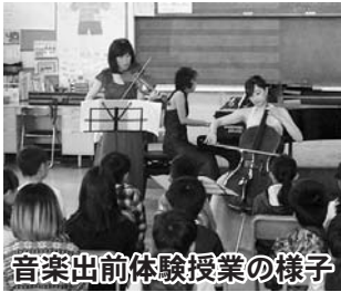
音楽出前体験授業の様子

子どもたちにできるだけ近くで演奏を見せようというため、1クラスずつ実施される授業は、45分間という短い時間で「これまで、楽器の習い事をしていない子どもたちが音楽に興味をもつよう」に「吹奏楽部」に入部す