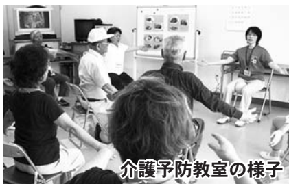
介護予防教室の様子

お近くにある介護予防教室に参加してみようと思われ人、また新たに自分のまちで介護予防教室をやってみようと思われ人は、気軽にお問い合わせください。