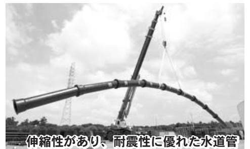
伸縮性があり、耐震性に優れた水道管

水道管の更新については、入れ替えの時期を迎えた地域や、劣化が原因と思われる事故が多く発生している地域の水道管の敷設替えを進めています。