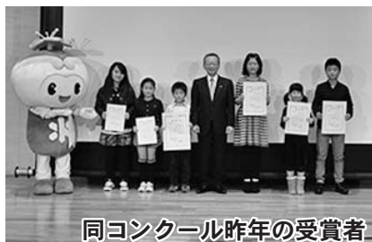
同コンクール昨年の受賞者

また、学び、感じたことを発表する場を設け、より多くの人々が「読んでみよう、勉強してみよう」と思うことを