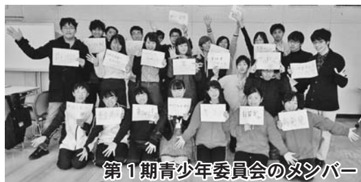
第1期青少年委員会のメンバー

同委員会には、一般公募で集まった市内の中学校・高校の生徒、大学生など約30人が参加しました。