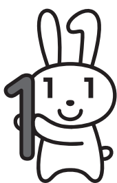
マイナンバー広報キャラクター「マイナちゃん」

※持ち物など詳しくはお問い合わせください。 お問い合わせ 市民窓口課（内線131、132）