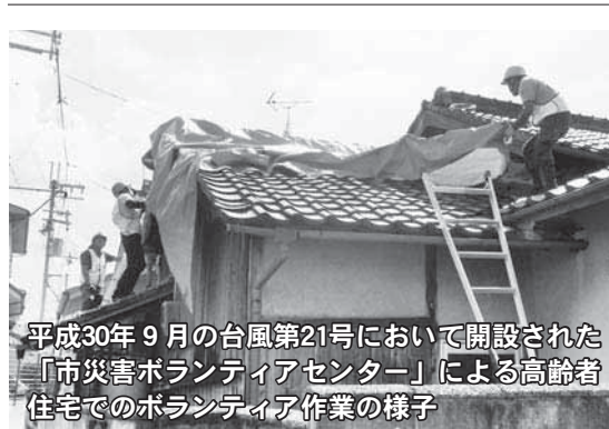
平成30年9月の台風第21号において開設された「市災害ボランティアセンター」による高齢者住宅でのボランティア作業の様子