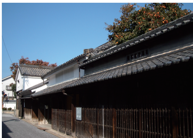
大阪府指定文化財 仲村家住宅の外観

仲村家には、江戸時代の写本や和漢書、明治期の雑誌等、さまざまな分野の書籍のほか、酒造関係の板木や印鑑等も残されていました。書籍は文化教養をうかがう資料として、また、板木や印鑑類は酒造業を視覚的に示すものとして、文書群を補足する資料であることから、「附（ついたり）」として富田林市指定文化財に指定しました。