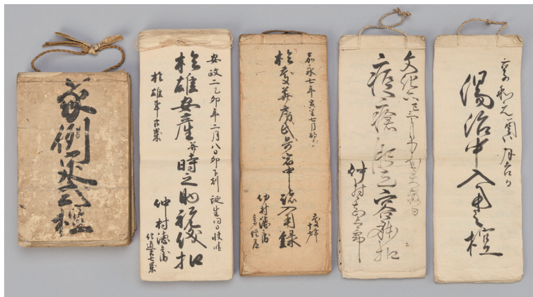
家族や生活に関する帳面類

「於雄安産并時之助祝儀扣（おゆうあんざんならびにときのすけしゅうぎひかえ）」は、当主の徳兵衛信道と妻おゆうの間に、長男時之助が誕生した時の記録ですが、通常みられる贈答を中心とした祝儀帳的なものではなく、実際に行われた産育儀礼について、一つ一つ具体的に臨場感をもって記されており、非常に興味深いものです。