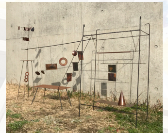
「夜の深さについて」(2019)