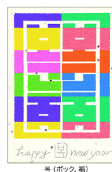
春 (ポツク, 福)