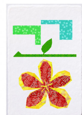
꽃 (꽃, 花)