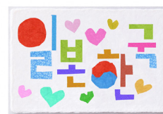
일본 한국 (일본 한국, 韓国)