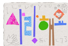
사랑해요 (사랑해요, 愛してるよ)