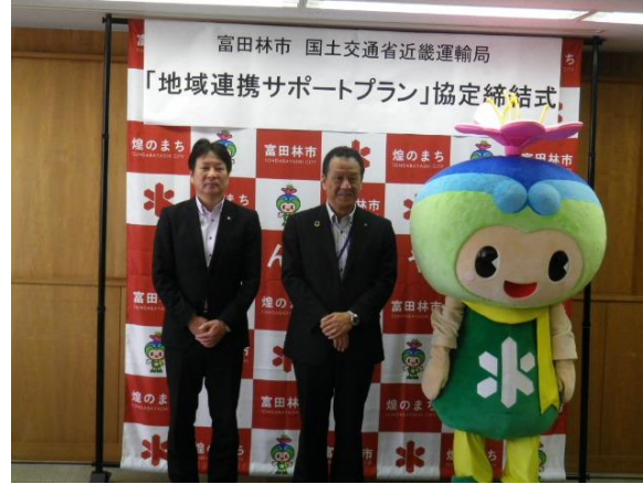
「地域連携サポートプラン」協定締結式