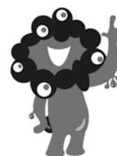
大阪・関西万博公式キャラクター ミャクミャク

大阪・関西万博では、150を超える国や地域、国際機関が参加します。多種多様なパビリオン(展示用の建物)やイベントを通じて、未来を体感してみませんか？