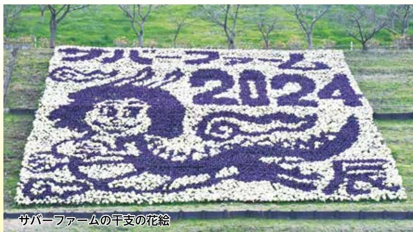
サバーファームの手支の花絵