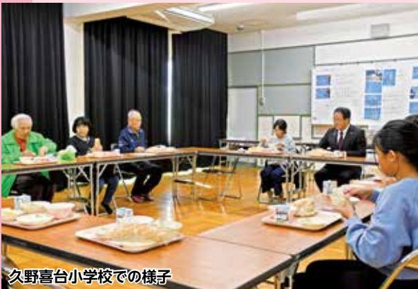
久野喜台小学校での様子

当日は秋晴れに恵まれ、訪れた人たちは食事やステージでのイベントを楽しんでいました。また、夕方には久野喜台一号公園で、イルミネーションの点灯式があり、たくさんの方が写真を撮って賑わっていました。イルミネーションは1月21日(日)まで点灯していますので、ぜひ一度足を運んでみてください。