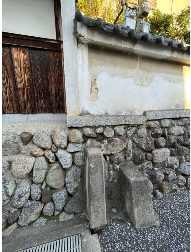
松井 家 土塀・石垣 [現況写真 (建物側)]