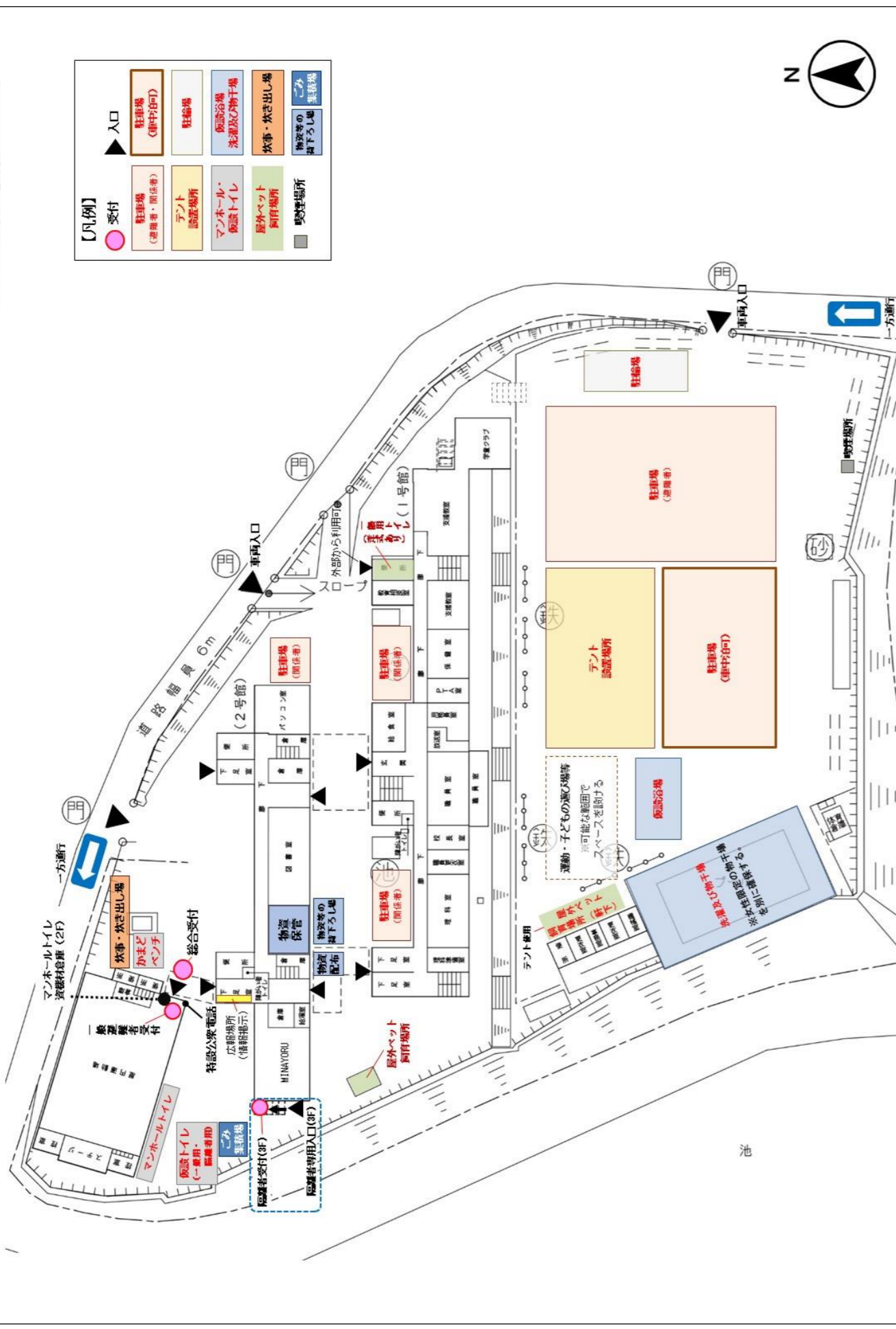
寺池台小学校 災害時学校利用計画(敷地図) ※令和6年10月1日現在

※教室等の利用状況により、避難所として利用するスペースの変更等が適宜必要となります。