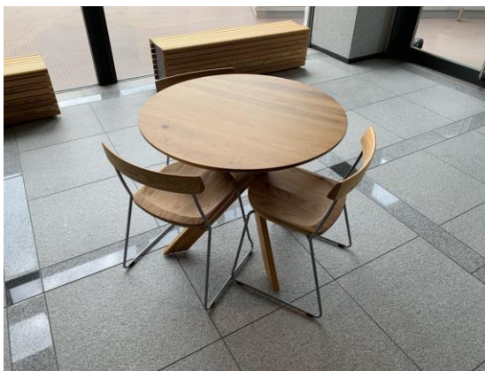
①庁舎建替えに伴う、分散配置施設の木製品導入 場所:すばるホール