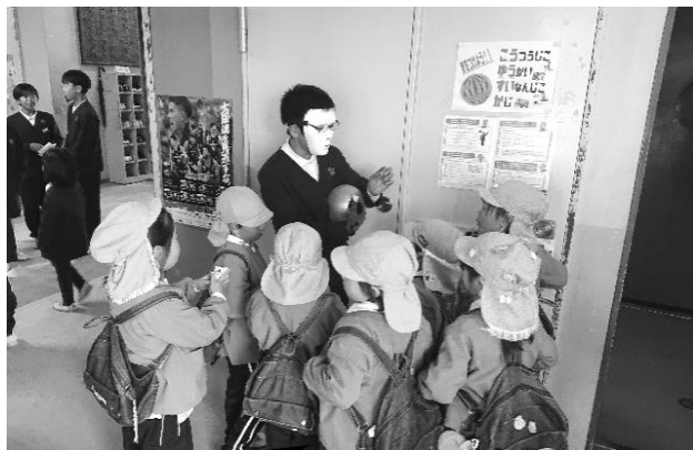
幼稚園の子どもたちも楽しそうです。

今年度も、3年生以上の学年の子どもたちが自分たちでお店の内容を考え、工夫をこらしたお店をクラスごとに出しました。当日は地域の見守りサポーターの方々や川西幼稚園の園児たちにも来てもらい、楽しく過ごしてもらうことができました。子どもたちも1・6年生、2・5年生、3・4年生のきょうだい学年で小グループを作ってお店を回りました。