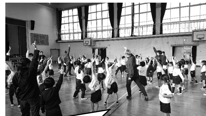
みんなで手をあげてポーズ！ よっしゃ、決まった～！！

12月6日（金）、ダンスのワークショップ（体験型学習）がありました。昨年度も来ていただいた「んまつーぽす」の方々を講師として迎え、1年生の子どもたちと一緒に表現運動を行いました。各グループに分かれて、「一週間」を月～金の曜日ごとにグループで表現しました。最後は「一週間」を続けて表現してまとめることができました☆