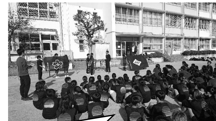
交流会の開会式の様子です。 校旗を広げて、選手宣誓！

同じ中学校区の6年生同士で交流を深める目的で今年度初めての取組みとなりました。最初はお互いに緊張していた両校の6年生。クラス対抗のなわとび（ハの字）や、学校入り混じっての綱引き、ジェンカ（フォークダンス）などですっかり打ち解けて、交流を深めていました（^_^）