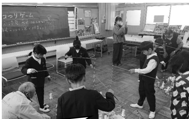
川西校区交流会議の方々も出店されました。