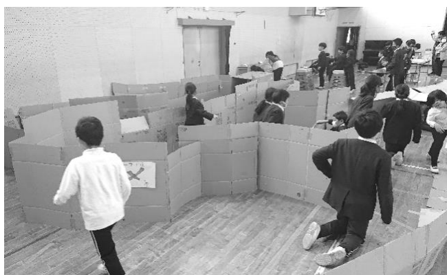
体育館には巨大迷路も！