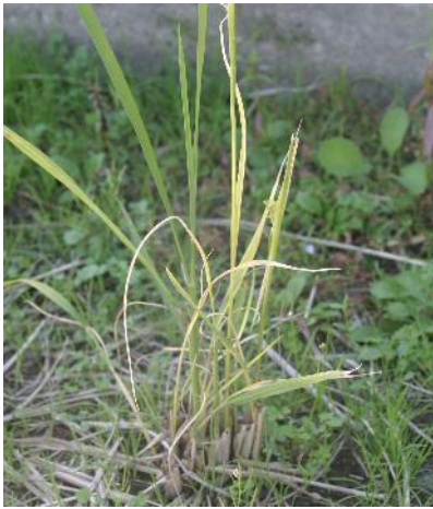
縞葉枯病(ひこばえでの病徴)