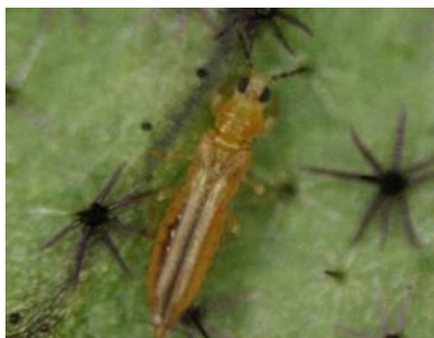
ミナミキイロアザミウマ成虫※