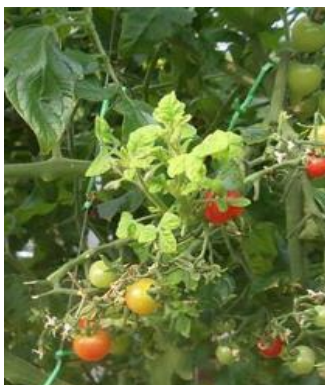
トマト黄化葉巻病発症株