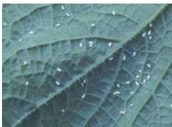
タバココナジラミ※