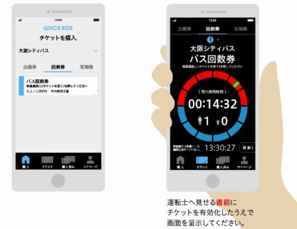
【参考】大阪シティバスのモバイルチケット