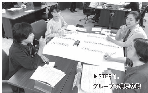
▶ STEP 1. グループで意見交換

10月25日、第3回目の委員会を開催し、こどもたちやこどもに関わりのある施設・団体などへのヒアリング方法について話し合いました。委員会の後半では、「こどもの定義」「こどもの権利条例の理念」をテーマにグループに分かれて、ワークショップを行いました。