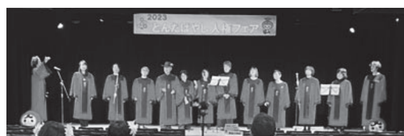
令和5年度の団体発表の様子