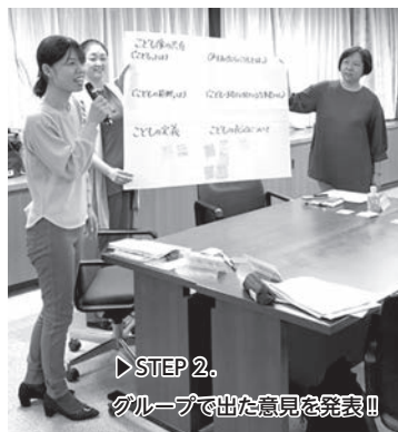
▶ STEP 2. グループで出た意見を発表!!

ワークショップでの意見をはじめ、こどもたち、市民などの声を聴きながら、今後の「こどもの権利条例」の制定に反映していきます。