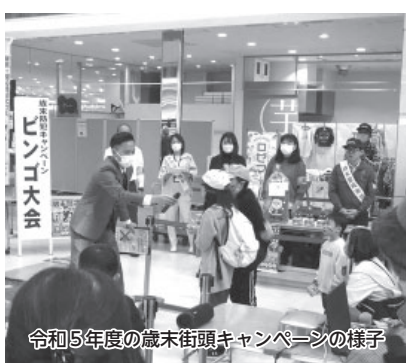
令和5年度の歳末街頭キャンペーンの様子