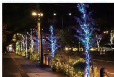
金剛地区でのイルミネーション(冬季限定)