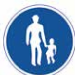
▲歩行者専用道路の標識

右記の標識が設置されている道路は「歩行者専用道路」の指定を受けているため、自転車やバイクなどの通行は禁止されています。