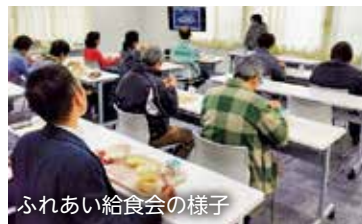
ふれあい給食会の様子