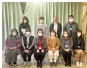
障がい者基幹相談支援センターと障がい者相談支援センターの職員の皆さん

全員：相談したいことが整理できていなくても大丈夫です。まずはお気軽にご相談ください。あなたらしく生活できるように、寄り添い応援させていただきます。みんなで一緒に笑えるようにあたらしく！