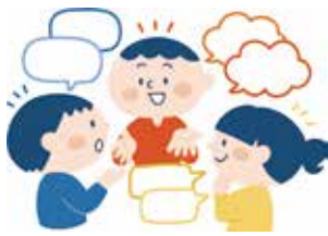
とんぱる 問 TONPAL (多文化共生・人権プラザ)