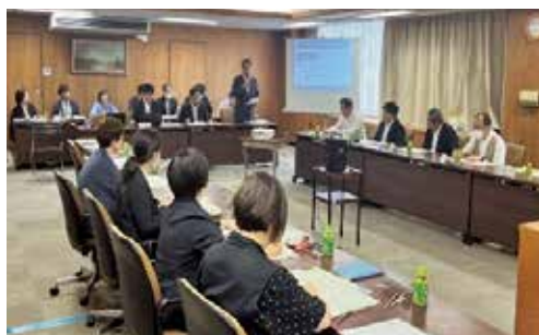
障がい者雇用会議の様子

草の根で地域資源と雇用側をつなぎ、就業支援の仕組みづくりの実現に向けた世の中づくりが必要だと感じています。