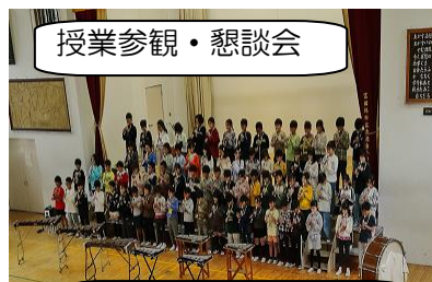
授業参観・懇談会

教室や体育館での授業参観にご参加ありがとうございました。子どもたちのがんばり、いかがだったでしょうか。