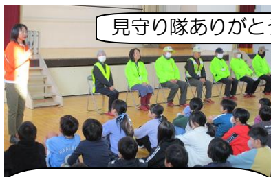
見守り隊ありがとうの会

いつもお世話になっている見守り隊の方へ感謝の気持ちを伝えました。今後もよろしくお願いします。