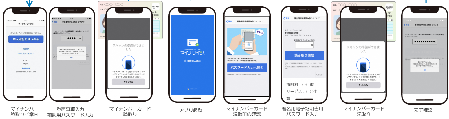
マイナンバー 読取りご案内