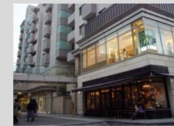
低層階に商業施設を併設したマンション