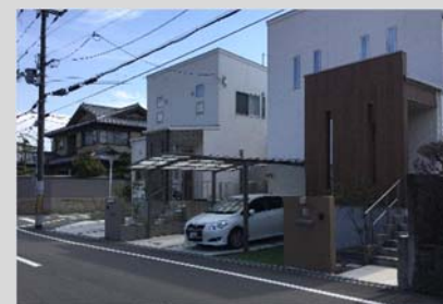
（大きな敷地を分割して住宅を新築）