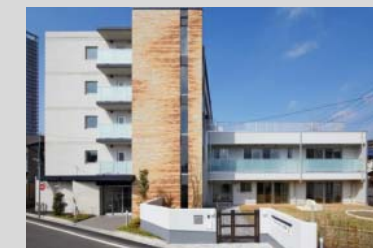
保育所を併設したマンション