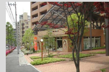
1階に商業施設を併設したマンション