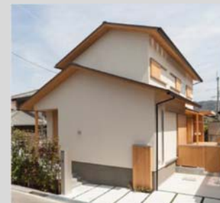
（両親から引き継いだ築30年程の戸建て住宅を子世代がリフォーム）