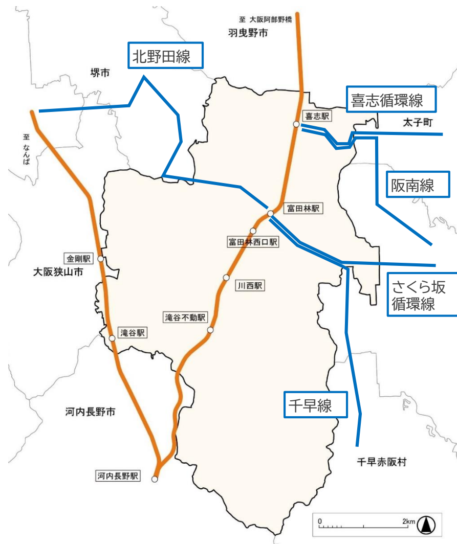
図. 地域間幹線系統補助対象路線図