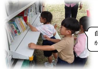
自動車文庫(つつじ号)が来ました！！

そら組に新しいお友達が入園します！！ 6/1～12までの期間、アメリカから一時帰国中の友達がそら組と一緒に過ごします。短い期間ではありますが、どうぞよろしくお願いいたします。