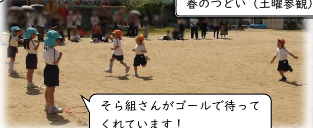
春のつどい（土曜参観）