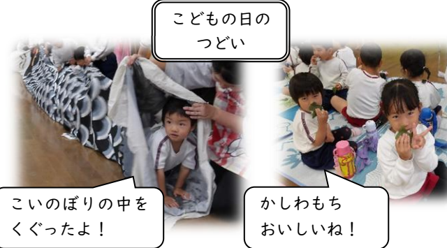
こどもの日のつどい