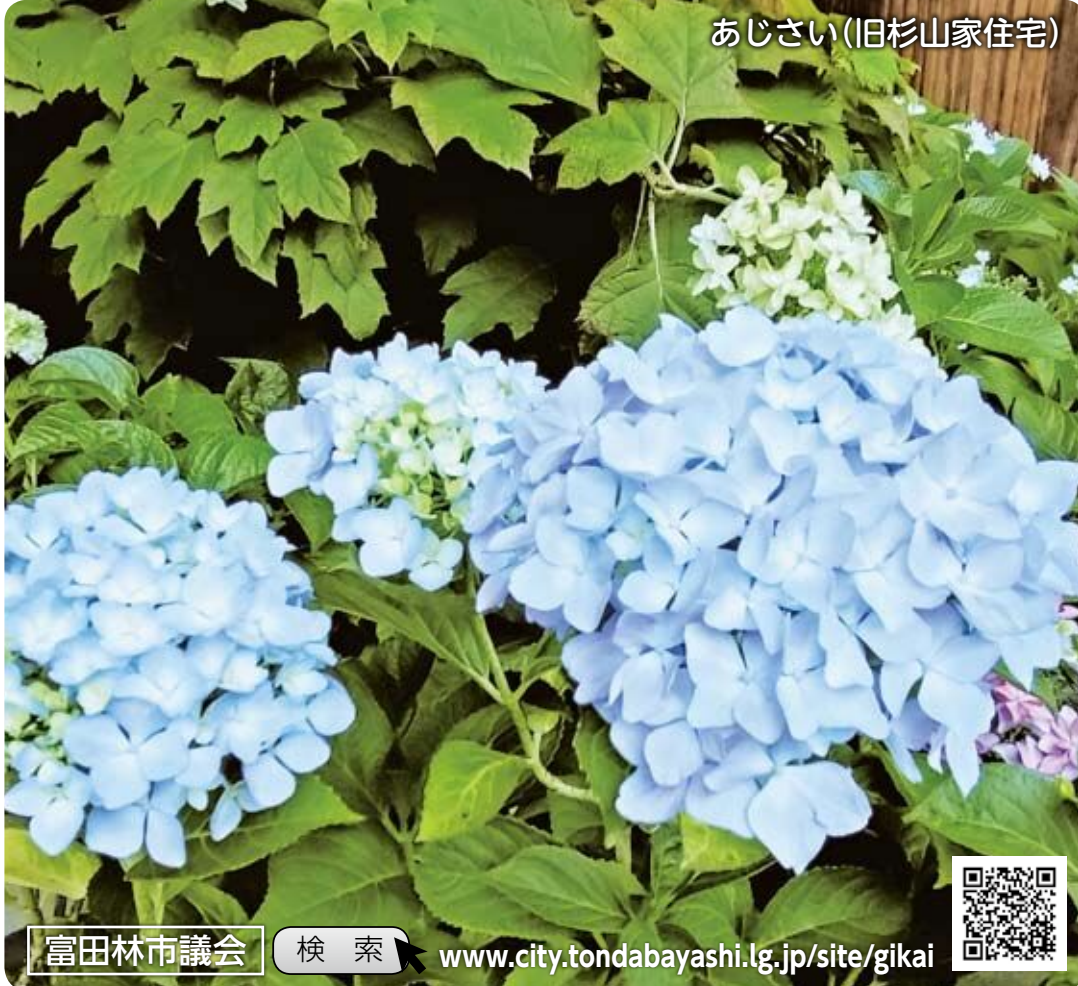
あじさい(旧杉山家住宅)