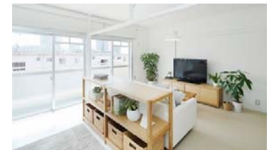
UR賃貸住宅のリノベーション(他地域の事例)