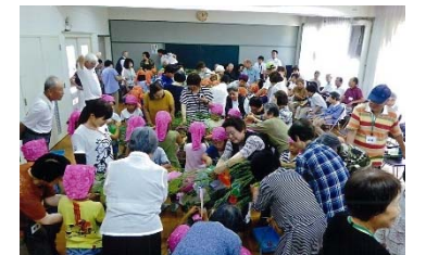
いきいきサロンでの多世代交流の様子