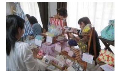
子育て中の親の社会参加を支えるシェアルーム