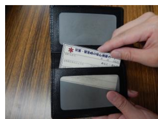
⑥ サイフなどに入れておきましょう

※このカードには、重要な個人情報に記載することになります。カードの利用、記入内容は任意ですので、ご自身の判断と責任においてご利用ください。