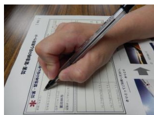
① 必要なことを書きこんで ※油性のボールペン、マジックペンで