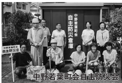
中野若葉町会自主防災会

今後、日頃の防災活動や地域で発生した災害へのいち早い対応など、地域防災の柱として住民の安全を確保するための活発な活動が期待されます。