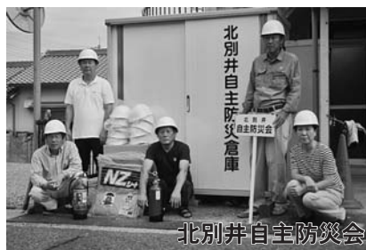
北別井自主防災会