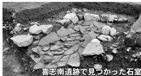
喜志南遺跡で見つかった石室

かがりの郷では、12月20日(日)までスポット展示「埴輪のジグソーパズル第2章～石川西岸の小さなお墓～」を開催しています。これにあわせて、「喜志南遺跡の埴輪物語」と題して歴史講座を開催します。