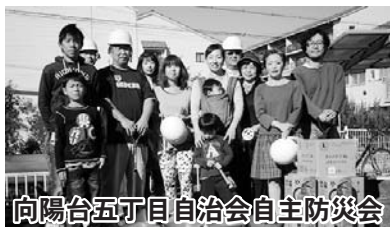
向陽台五丁目自治会自主防災会

新たに、向陽台五丁目に自主防災組織が結成され、消火器やヘルメット、発電機などの防災資機材が配備されました。