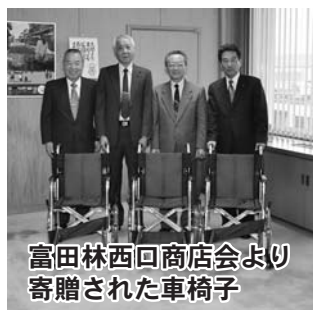
富田林西口商店会より寄贈された車椅子

また、10日間程度であれば貸し出しもしていますので、詳しくはお問い合わせください。