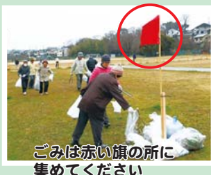
ごみは赤い旗の所に集めてください

ごみや枯れ草を燃やすことによりダイオキシンが発生したり、自然環境を破壊したりするため、全てのごみは燃やさないで決められた場所に集めてください。ごみは後日、府が収集します。