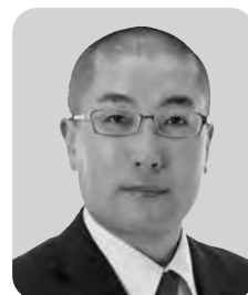
伊東 寛光 大阪維新の会 1期