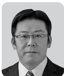
山本 剛史 自由民主党 4期