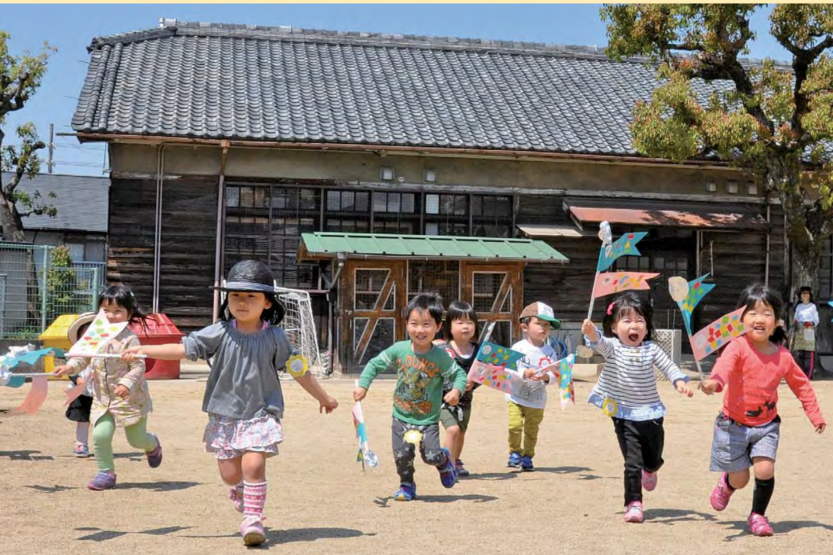
青葉丘幼稚園内第2幼児教育センターで、楽しそうに遊ぶ子どもたちの様子。 ※関連記事17・20 ページ