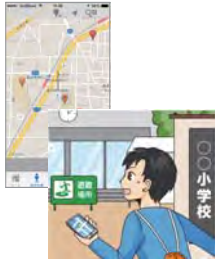
災害時は最寄りの避難所まで誘導してくれます。