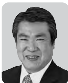
高山 裕次 公明党 5期