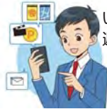
いつでも気象庁のデータや避難所が確認できます。