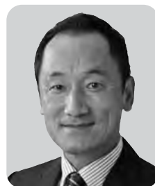
岡田 英樹 日本共産党 3期