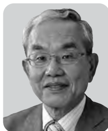
奥田 良久 日本共産党 8期