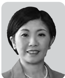
村山 理恵 公明党 1期