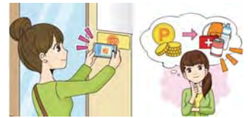
スマートフォンを防災啓発ステッカーにかざすとポイントを貯めることができます。