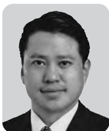
京谷 精久 自由民主党 5期