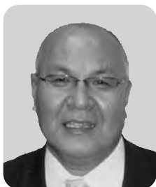
左近 憲一 自由民主党 5期