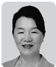
林 光子 自由民主党 7期