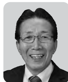
西川 宏郎 自由民主党 3期