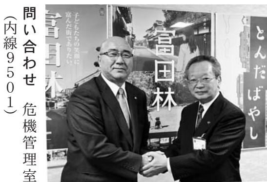
問い合わせ 危機管理室 (内線9501)

そのためにも、今後とも富田林市には、ご支援をいただければと思っております。受けた恩を忘れずに、充実した行政運営をしていきたいと思っております。今後ともいろいろな形でお付き合いを願えればと思います。 市長 ぜひこれからも、いい交流ができれば、ありがたいと思うています。 平野町長 ありがとうございます。