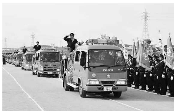
とき 1月8日(日)、午前10時(小雨決行) ところ 石川河川敷川西グランド 問い合わせ 市消防本部消防総務課(☎(23)1123)

申し込み 2月6日(月)～、市消防本部予防課で配布する申込書に必要事項を記入し、2月10日(金)までに、同課(☎(23)1124)へ(電話申し込み不可)