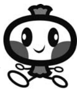
町イメージキャラクター「おおちゃん」

大槌町は、岩手県東部の太平洋沿岸に面している町で、リアス式海岸として知られる三陸海岸のほぼ中央に位置しています。