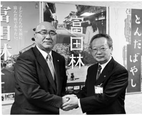
問い合わせ 危機管理室 (内線9501)

そのためにも、今後とも富田林市には、ご支援をいただければと思っております。受けた恩を忘れずに、充実した行政運営をしていきたいと思っております。今後ともいろいろな形でお付き合いを願えればと思います。 市長 ぜひこれからも、いい交流ができれば、ありがたいと思うています。 平野町長 ありがとうございます。