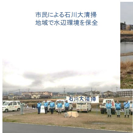
市民による石川大清掃 地域で水辺環境を保全