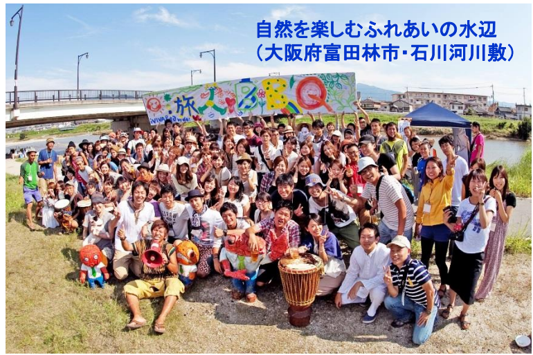
自然を楽しむふれあいの水辺 (大阪府富田林市・石川河川敷)