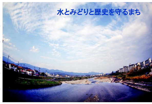
水とみどりと歴史を守るまち

昭和42年頃から下水道整備事業に着手し、効率的な下水道整備を推進 (富田林市の下水道普及率:H8年度末 55.5% → H27年度末 88.0%)