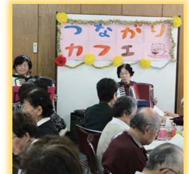
左上から、ふらっとスペース金剛、ふれあい大通り、久野喜台いきいきサロン、寺池公園、金剛地区まちづくり会議、金剛バルペットボトルツリー、金剛きらめきイルミネーション、金剛中央公園、つながりカフェ