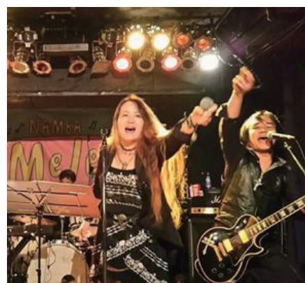
APPLAUSE + NOBU