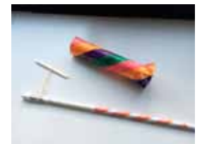
①5月の教室はクルクルまわりながらとぶ「ゴムロケット」