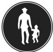
歩行者専用道路の標識