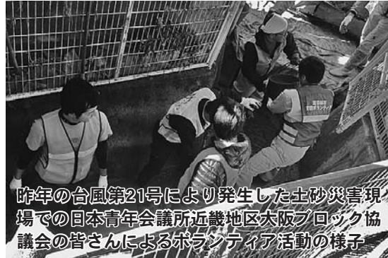
昨年の台風第21号により発生した土砂災害現場での日本青年会議所近畿地区大阪ブロック協議会の皆さんによるボランティア活動の様子

皆さんも、この機会に防災への認識と日頃の備えを十分におきましよう。お問い合わせ 危機管理室 (内線9503)