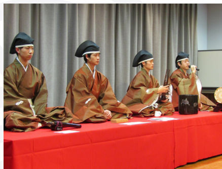
※当日は5人編成で演奏します。