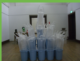
ザ・ダストマンズ (2012)