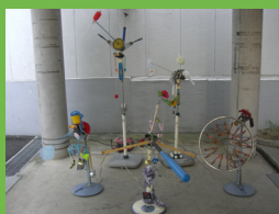
ジャンジャン合唱団 (2014)