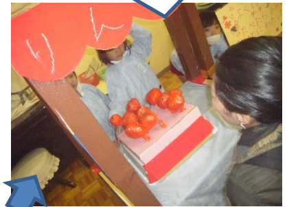
地域のだんじり祭りから

◆日々の生活の中で経験した ことや感動したことが次の 楽しい遊びにつながって いきます。そして、遊びの 中でいろいろなことを考え たり、工夫したりするよう になり、日々成長していま す。