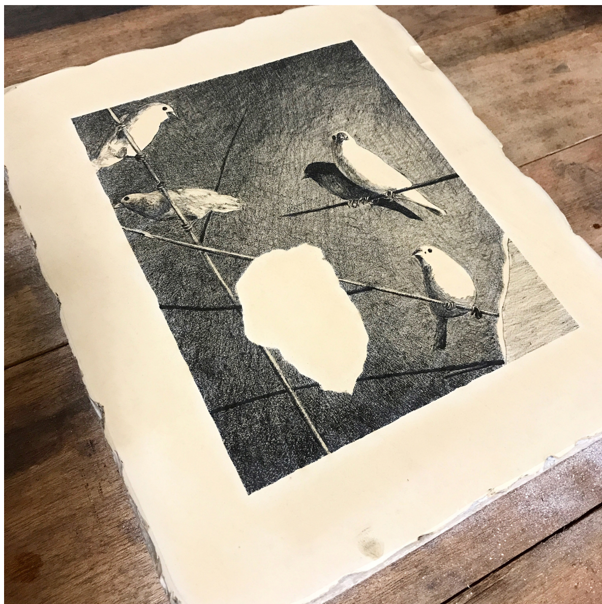
Java sparrow / 2017 / 255×310mm / 石版