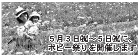
5月3日(祝)～5日(祝)に、ポピー祭りを開催します