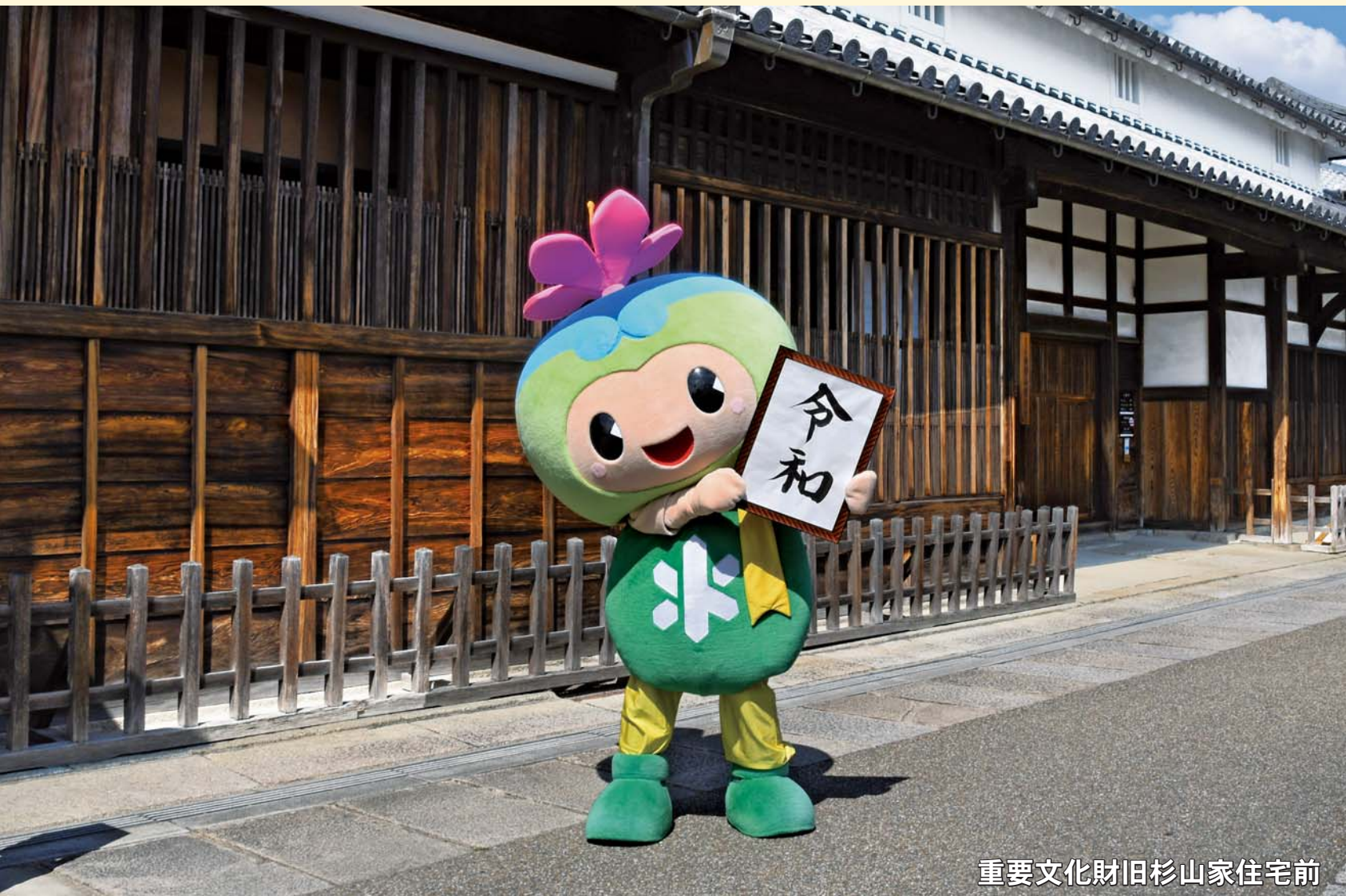
重要文化財旧杉山家住宅前