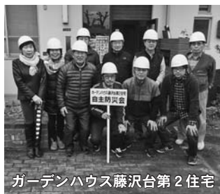
ガーデンハウス藤沢台第2住宅