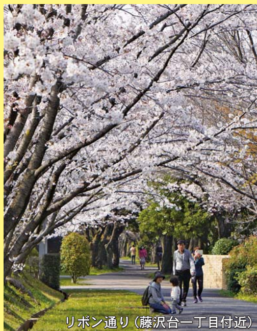
リボン通り（藤沢台一丁目付近）