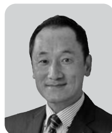
岡田 英樹 日本共産党 4期