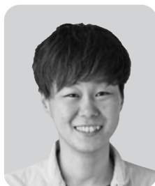
坂口 真紀 立憲民主党 1期