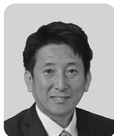
西川 宏 自由民主党 1期