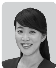
南方 泉 自由民主党 1期