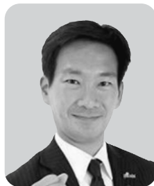
村瀬 喜久一郎 大阪維新の会 1期