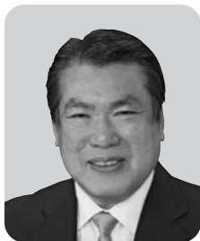
高山 裕次 公明党 6期