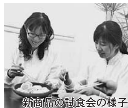
新商品の試食会の様子

大市珍味ではこれからもチームワークを大切に、お客様のニーズにお応えする新商品の開発に取り組んでいきます。